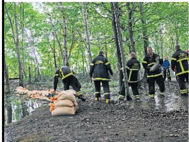
et skal blandt andet træne at producere og lægge sandsække ud. Senest skete det i en mere skarp situation, da Vidåen i august 2015 truede med at gå over sine bredder ved broen i Tønder.

Uder op at bekæmpe den stigende vandstand handler øvelsen også om at patruljere på de trede dige, og på et tidspunkt - det kan allerede røbes nu - bliver der også brug for sandsække. Det er et scenarie, der minder om august-højvandet for to år siden, hvor Vidåen dagen efter skybruddet var ved at gå over sine bredder.