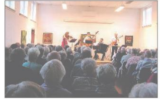
Dyvorbjerg kommer igen til Rebølcenteret næste år.