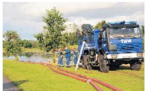
I august 2015 var tyske heder fra THW (Technisches Hilfswerk) med deres hejkapacitetspumper med til at afværge en forvandede situation i Tønder Nord. Indsatsen fra dengang har været med til at afværge et ulideligt grænsoverskridende beredskab, der er døbt "Beredskab uden grænser 2.0".