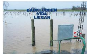
Forhøjede og forvandede vandstande omkring pumpestationen Lægån er styret realistisk scenarie. Billedet er fra efteråret 2015.