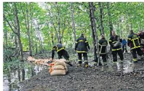
Beredskabet skal blandt andet træne at producere og lægge sandsække ud. Senest skete det i en mere skarp situation, da Vidåen i august 2015 truede med at gå over sine bredder ved Jernbanebroen i Tønder.