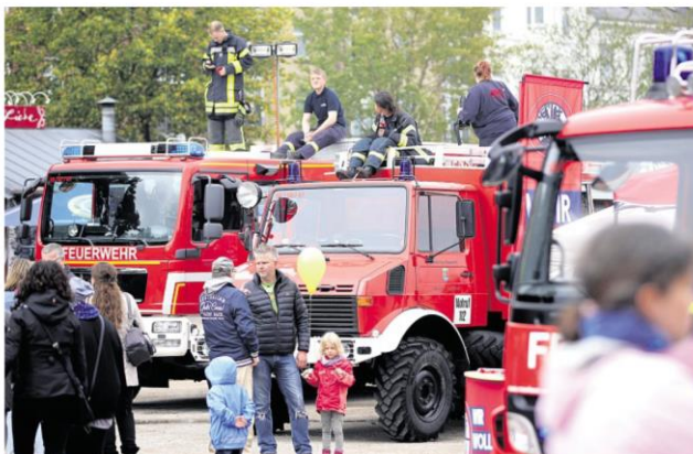
Immer dicht umlagert waren die Feuerwehrlleute, die mit zahlreichen Aktionen auf sich aufmerksam machten.

Große staunende Kinderaugen gab es aber nicht nur beim Zollpavillon. Auch der Wasserwerfer der Bundespolizei zog große und kleine Interessenten an. Wer ein derartig eindrucksvolles Gefährt noch nie aus nächster Nähe betrachtet hatte, konnte es dann spätestens am Samstag tun. 10.000 Liter Wasser fasst der Wasserbehälter des Fahrzeugs. Ein wenig skurril wirkte die Szenerie aber dennoch: Fast wie ein überdimensionales Spielzeugauto stand der Wasserwerfer neben der Riesenschleuche des Technischen Hilfswerks (THW). Beide gehörten zu den auffälligeren Sehenswürdigkeiten und wurden dementsprechend mit Aufmerksamkeit bedacht. Der Geräuschpegel des Blaulichttages passte zum Motto: Sirenen und Mar-